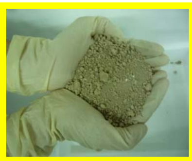
②試料の適正量(500g 程度)