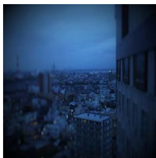
こちらの方向に弊社