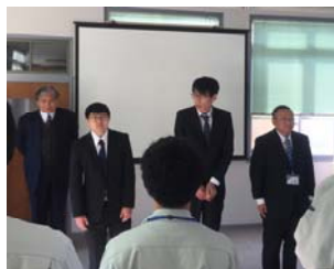
入社式では とても緊張しました