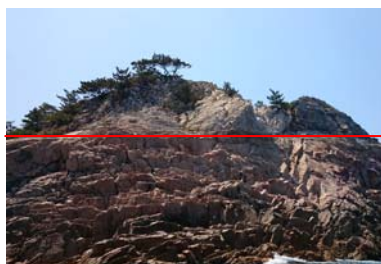
ルーフペンダント